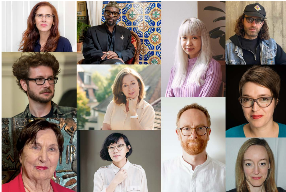
Die Juror*innen von DOK Leipzig 2022

Fünf Goldene Tauben und vier Silberne Tauben vergeben die Jurys der Internationalen Wettbewerbe, der Deutschen Wettbewerbe und der Wettbewerbe um den Publikumspreis