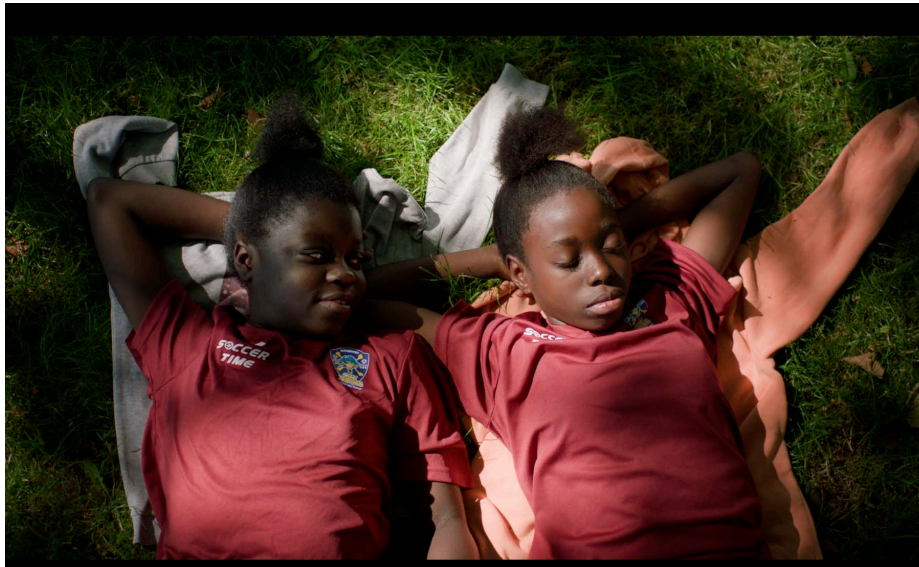
Goals (Regie: Florinda Ciucio) | Kids DOK

DOK Leipzig zeigt 27 Animations- und Dokumentarfilme für das junge Publikum | Außerdem: Angebote für Lehrende und Schüler*innen bei DOK Bildung